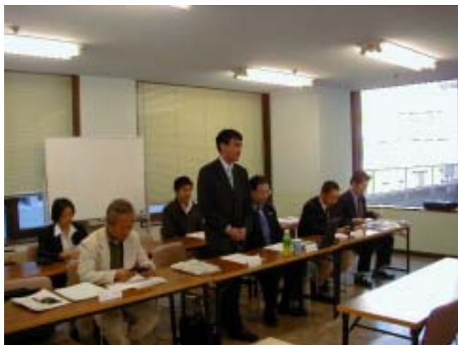
總會風景 (河野会長挨拶)